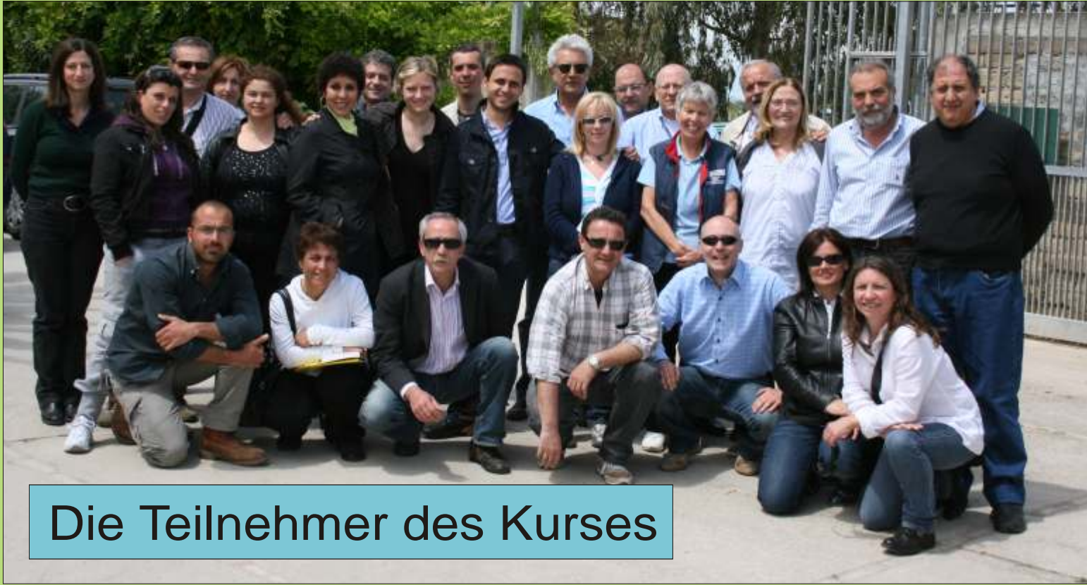
Die Teilnehmer des Kurses